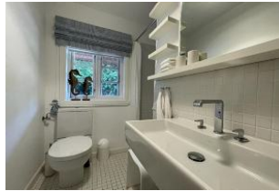
Badezimmer mit Dusche