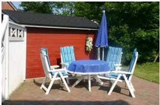
Eine nette Sitzecke auf der Terrasse darf hier nicht fehlen. Ideal um bei Sonnenschein ein Stückchen Friesland in aller Ruhe zu genießen.