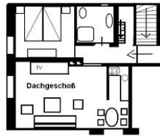
Der Grundriss der Wohnung.