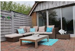
Die Gemeinschaftsterrasse vor dem Haus