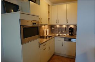
Die moderne Einbauküche.