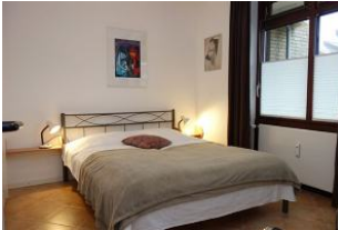
Das Schlafzimmer mit Doppelbett 160x200cm