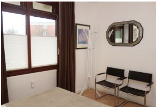
Stühle und Spiegel im Schlafzimmer