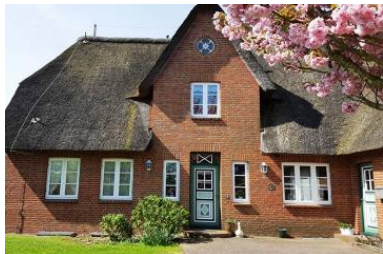
Haus Faltings in ruhiger Lage im Ortsteil Goting mit 3 Wohneinheiten