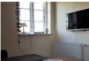
Grosses helles Wohnzimmer mit Holzfußboden