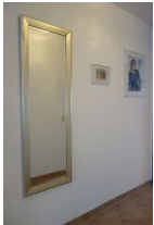
...noch ein letzter Blick in den großen Spiegel...