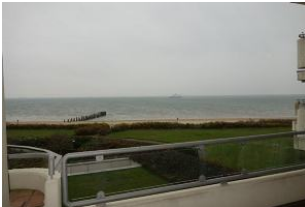
Der winterliche Blick aufs Meer