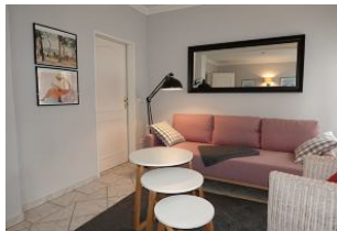
...hier noch einmal die Couch, die Tür führt zum Schlaftrakt.