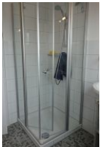
...und flacher Duschkabine.