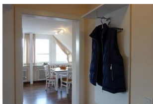
...treten Sie ein ...