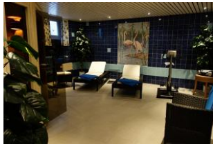
Der Fitnessbereich im Untergeschoß mit...