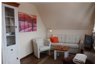
Der Wohnbereich für gemütliche Stunden