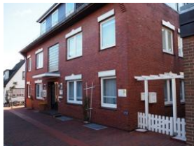
Ansicht Haus Teunis Mühlenstr.