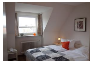
Das Schlafzimmer mit Doppelbett (180x200cm)