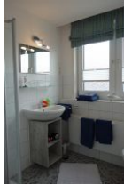
Das Bad mit Handwaschbecken, Toilette (nicht im Bild)