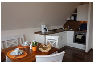
Die offene Küchenzeile mit Essplatz