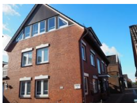
Ansicht Haus Teunis Carl-Häberlin-Str.