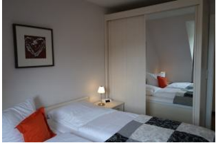
...und großem Kleiderschrank