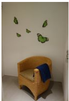
...und gemütlichem Sessel zum ausruhen.