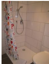
....und flacher Duschwanne.