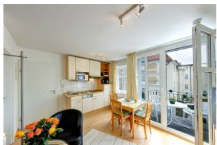
Küche mit Esszimmer

Direkt an der Strandpromenade mit SÜDBALKON und FAHRSTUHL im Haus! Schönes geräumiges 2-Zimmer-Apartment mit geschmackvoller guter Ausstattung. Separates Schlafzimmer (mit Fernseher), Wohnzimmer mit Küchenzeile und Essplatz, Duschbad, Balkon nach Süden mit Sonne bis abends. Die Wohnung verfügt über einen Tiefgaragen-Pkw-Stellplatz. In der Garage können auch Fahrräder und ähnliches untergestellt werden. In unserer "Villa Germania" nebenan gibt es eine Sauna. Von der "Villa Aquamarina" aus können Sie das Ortszentrum und die bekannte Ahlbecker Seebrücke in ca. 3 Minuten zu Fuß erreichen. Zum Strand sind es 50 m.