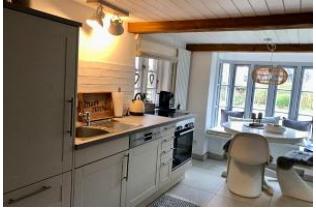
separate Küche mit Esstisch