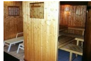
Die kleine Sauna im Keller des Hauses.