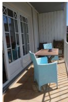
Der Balkon mit Tisch + 2 gemütlichen Sesseln. Zudem steht ein Hochlehner (Rückenlehne verstellbar) und Holzstühle zur Verfügung.