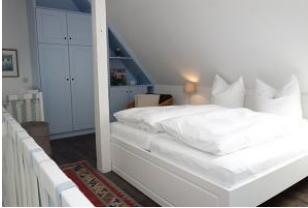
Das Doppelbett 180x200cm auf der Galerie, sowie...