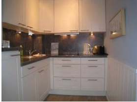
... mit allem Drum und Dran.