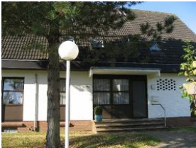
Die Haustür des Hauses Gmelinstr. 28 Haus 5