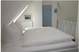
...eine Garderobe zum Kleiderlüften, und.....