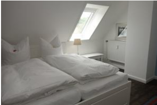
...ein Fenster um die frische Luft herein zu lassen.