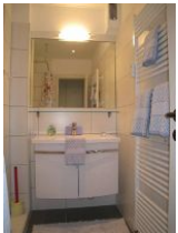
Das Bad mit Waschtisch...