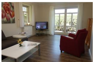
Gemütlicher Sessel, großes TV Gerät mit DVD Player ....