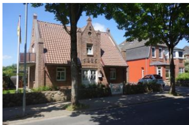
Das Haus Badestrasse 30a in Wyk

Die Unterkunft verteilt sich über EG und UG.