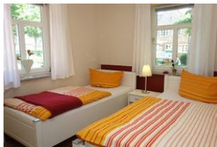
Im Erdgeschoß das Schlafzimmer mit zwei Einzelbetten und ...