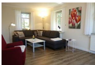
Die Wohnlandschaft - herrlich zum relaxen...