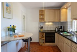
Die separate Küche ...