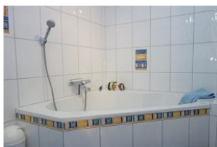
Das Wannenbad ebenfalls im Erdgeschoß mit...