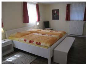
Ein großes Schlafzimmer im UG