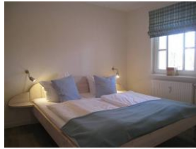
Das Elternschlafzimmer mit großem Doppelbett 180x200cm