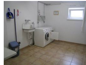
Waschmaschine und Trockner gegen Gebühr im Keller des Hauses