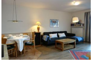
...der Esstisch und der Blick zur Couch