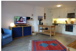
das TV Gerät darf natürlich auch nicht fehlen.