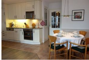
Esstisch und Küche, nur ein paar Schritte