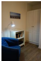
...kleiner Rückzugsort - der Lesesessel im Kinderzimmer