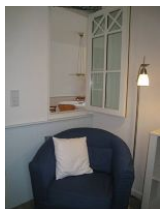
Das offene Fenster zum Wohnzimmer garantiert die Belüftung des Zimmers. Klingt komisch, klappt aber....