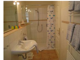
... einer herrlich großen Duschkabine.