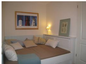
Im Kinderzimmer ein kuscheliges Einbaubett. Achtung: das Bett verfügt über eine Größe von 180x178cm...