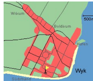
Entfernungen, zirka: zum Bäcker 20 m, zur Einkaufsmöglichkeit 200 m, zum Flugplatz 1,2 km, zum Golfplatz 1,4 km, zum Hafen 1,5 km, zum Meer 80 m, zum ÖPNV 300 m, zum Badstrand 80 m, zum Ortszentrum 1,2 km