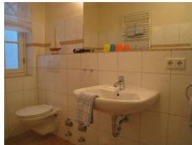
Im Badezimmer Handwaschbecken und WC, sowie...