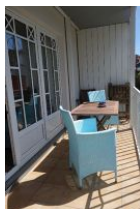
Der Balkon mit Tisch + 2 gemütlichen Sesseln. Zudem steht ein Hochlehner (Rückenlehne verstellbar) und Holzstühle zur Verfügung.