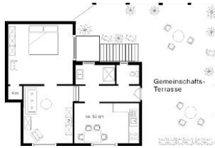
Der Grundriss der Wohnung.