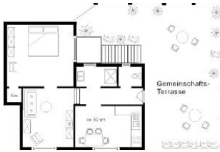
Der Grundriss der Wohnung.