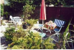
Die Gemeinschaftsterrasse steht allen Gästen des Hauses zur Verfügung.