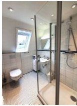
Das helle Duschbad bietet genügend Platz für die ganze Familie.