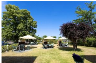
Garten mit Terrassen und Strandkörben (Mai bis September)