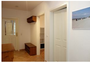
Treten Sie ein ....