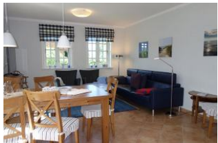
Ein Blick ins Wohn/Esszimmer - einladend....