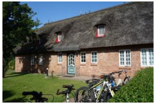
Der Eingang zu den Wohnungen 1, 2, 4 und 5

Das Hus Dikstian in Alkersum mit insgesamt 5 Wohneinheiten bietet auch befreundeten Familien die Möglichkeit "unter einem Dach" zu wohnen. Die Wohnung 1 befindet sich im hinteren Teil des Hauses, welches zum Garten gelegen ist. Sie verfügt über 3 Schlafzimmer mit 6 Betten normaler Größe. Das große Wohn/Esszimmer bietet jedem Familienmitglied ein Plätzchen. Die sep. Küche, voll eingerichtet, gibt auch dem Hobbykoch eine Chance. Das reetgedeckte Haus steht auf einem großen Grundstück, welches für alle Gäste zu nutzen ist. Zu jeder Wohnung gehört eine eigene Terrasse. Parkplatz auf dem Grundstück.