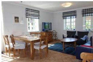
Essplatz und TV Gerät