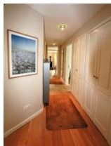
Aus dem hellen Flur erreichen Sie jedes Zimmer