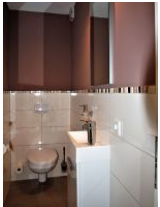
Das kleine und separate Gäste-WC