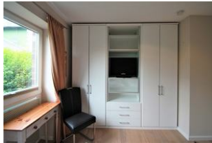
... und großem Kleiderschrank