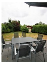
Die schöne Terrasse mit dem eigenen kleinen Garten