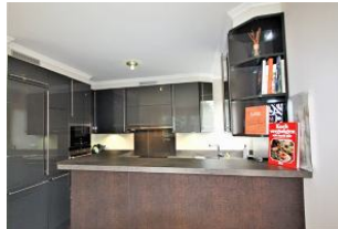
Die voll ausgestattete Küche mit Tresen ...