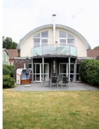
Das architektonisch einmalige Haus von außen.