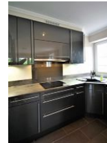
... ist hochwertig eingerichtet