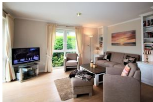
Das gemütliche Wohnzimmer

Herzlich Willkommen in dieser großzügig geschnittenen und hochwertig eingerichteten Ferienwohnung in diesem architektonisch einmaligen Haus. Die Ferienwohnung für bis zu 4 Personen befindet sich im Erdgeschoss. Ein kleiner blickgeschützter Garten ist direkt von Ihrer Terrasse zu betreten. Die Küche ist mit allem ausgestattet, was Sie für ein perfektes Dinner mit der ganzen Familie benötigen. Der offene Essbereich bietet viel Platz für gemeinsame Abende. Beide Schlafzimmer verfügen über einen eigenen Fernseher, im großen Schlafzimmer findet Ihre Kleidung Platz im begehbaren Kleiderschrank. Im Badezimmer finden Sie neben einer Dusche auch eine gemütliche Badewanne. Ein Carport für Ihr Auto steht auf dem Grundstück zur Verfügung.