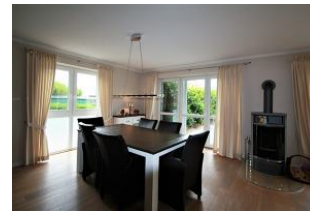
Der große Essbereich für gemeinsame Stunden