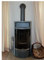
Der schöne Kaminofen für kuschelige Abende