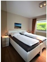
Das zweite Schlafzimmer mit zwei Einzelbetten ...