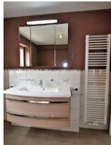
Das große Badezimmer ...