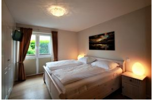
Das große Schlafzimmer mit Doppelbett ...