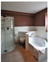
... mit Dusche und Badewanne