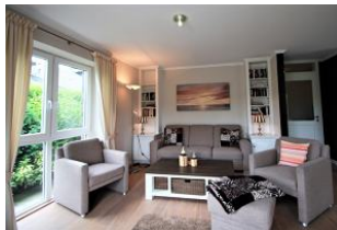
Von hier aus gelangen Sie direkt auf die Terrasse und in den kleinen Garten