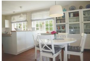
Der runde Eßtisch grenzt direkt an die Küche an und wirkt gemütlich.