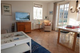
Der Blick ins Wohnzimmer, die Leseecke