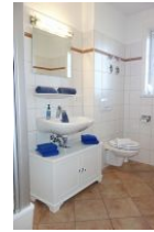
Handwaschbecken, Ablage, Toilette