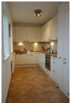
Die sep. Küche vom Wohnzimmer aus zu begehen.