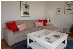
.....machen Sie es sich gemütlich .....