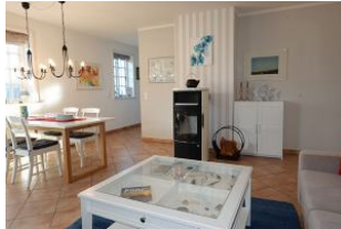
Der Ofen ist mit Holz zu füttern. Links im Hintergrund die Küche.