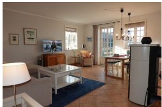
Treten Sie ein...ein herrlicher, oft sonnendurchfluteter Wohnraum erwartet Sie.