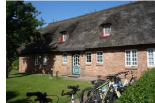
Der Eingang an der Seite führt zu den Wohnungen 1, 2, 4 und 5, hier befindet sich auch der Fahrradparkplatz