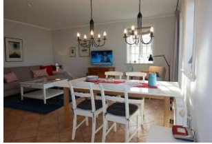
Der Esstisch. Im Hintergrund das TV Gerät und die Couch.