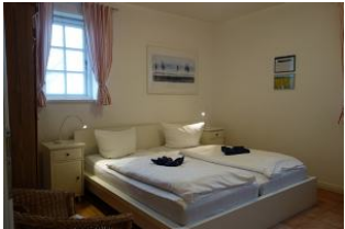
Ein Schlafzimmer mit Doppelbett 180x200cm