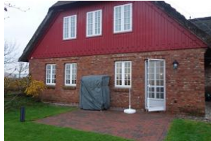
Die Terrasse im Herbst.