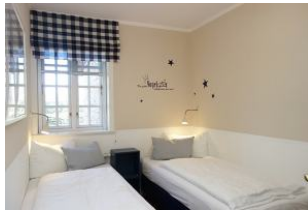
Ein Schlafzimmer mit 2 Einzelbetten (je 90x200cm)