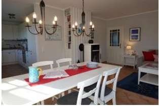
der lange Esstisch, im Hintergrund der Ofen.