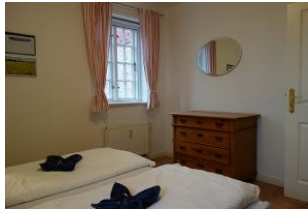
Kommode im Schlafzimmer, nicht im Bild der Kleiderschrank