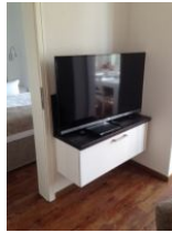
großer Flachbild TV