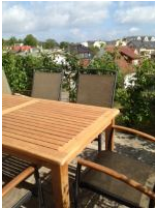
Terrasse mit Garten