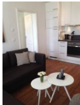
Wohnraum mit offener Küche