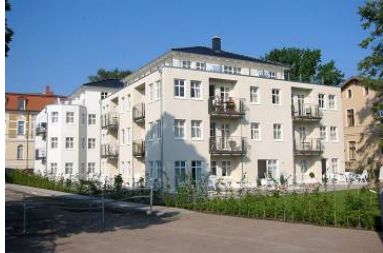
Architekturansicht "Villa Aquamarina" von der Promenade