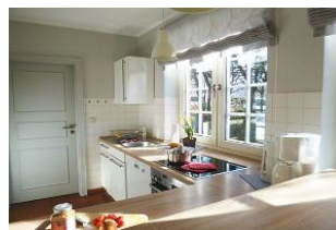
Die Komfortküche mit Geschirrspüler, Backofen, Tiefkühler und Mikrowelle ist reichhaltig ausgestattet.