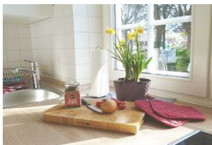
Das lädt zum Kochen mit regionalen Produkten ein.