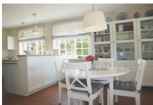
Der runde Eßtisch grenzt direkt an die Küche an und wirkt gemütlich.