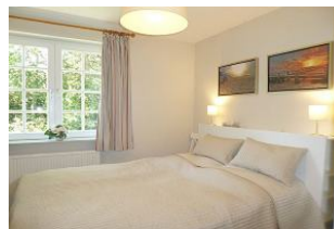
Das kleine heimelige Schlafzimmer mit Doppelbett (160 x 200 cm).