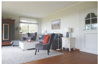
Ein Sofa und zwei Sessel laden zu einem TV-Abend ein.