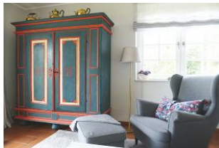
Zur Ausstattung gehören ein LCD-Flatscreen-TV, Bluetooth CD-Player, DVD-Player, Radio und WLAN zur kostenfreien Nutzung.