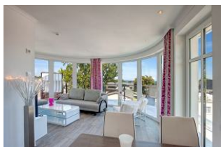
Blick in den Wohnraum

SEHR MODERN und mit SEEBLICK aus dem Wohnraum mit GROSSER FENSTERFRONT zur SEESEITE und von der GROSSEN DACHTERRASSE (ca. 55 qm mit Strandkorb und Möbeln). Mit FAHRSTUHL, nur ca. 100 m zur Strandpromenade! Luxuriös und komfortabel eingerichtete 2 - Zimmer - Wohnung mit sehr guter Ausstattung! Separates Schlafzimmer, ein zum Schlafzimmer offenes Bad mit großer walk-in-Dusche und Badewanne, ein separates WC. Der große Wohnbereich besticht durch eine gerundete Fensterfront und einen schönen Küchen- und Eßbereich, sowie einen KAMINOFEN. Die Wohnung verfügt über FUSSBODENHEIZUNG. Sie nimmt mit der großen Dachterrasse das gesamte Dachgeschoß des hinteren (seeseitigen) Hausteils ein. Zur Wohnung gehört ein STRANDKORB AM STRAND. Sie verfügt über einen Pkw-Stellplatz in der teilüberdachten Tiefgarage. Fahrradabstellfläche ist vorhanden. Vom Haus aus können Sie das Ortszentrum und die Ahlbecker Seebrücke in ca. 2 Minuten zu Fuß erreichen.