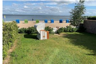
Der Garten mit überdachter Terrasse, Strandkorb (April-Oktober), Gartenmöbeln und direktem Strandzugang steht Ihnen zur alleinigen Nutzung zur Verfügung.