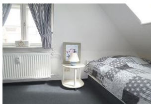
Das zweite gemütliche Schlafzimmer im Dachgeschoss verfügt über 2 Einzelbetten.