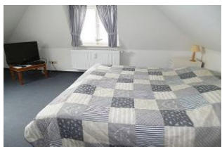
Unter gemütlichen Dachschrägen befindet sich das behagliche Schlafzimmer mit Doppelbett. Dieses kann auch zu zwei Einzelbetten auseinander geschoben werden. Flat-Screen TV und DVD-Player stehen zur Verfügung.