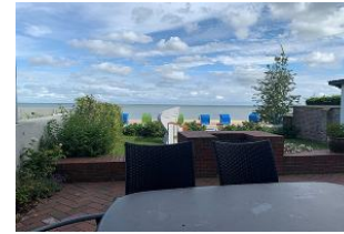
Die überdachte Terrasse ist möbliert.