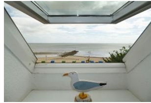
Von den Schlafräumen im DG hat man einen traumhaften Ausblick!