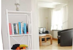
Das Ambiente der Wohnung wirkt heimelig und einladend.