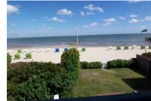
Das Foto zeigt den Blick vom Balkon des Hauses und das lädt zu jeder Jahreszeit ein. Hier können Sie einen Erholungsurlaub der kurzen Wege mit Nordseeluft pur genießen. Man spürt regelrecht die leichte Meeresbrise.....