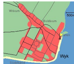
Entfernungen, zirka: zum Bäcker 25 m, zur Einkaufsmöglichkeit 25 m, zum Flugplatz 3,0 km, zum Golfplatz 3,0 km, zum Hafen 50 m, zum Meer 2 m, zum Badestrand 2 m, zum Ortszentrum 0 m