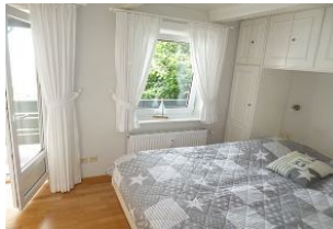
Das Schlafzimmer mit Doppelbett liegt im 1. OG in Richtung Strand und hat ebenfalls einen Balkon mit Meerblick.