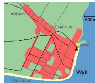
Entfernungen, zirka: zum Bäcker 25 m, zur Einkaufsmöglichkeit 25 m, zum Flugplatz 3,0 km, zum Golfplatz 3,0 km, zum Hafen 50 m, zum Meer 2 m, zum Badestrand 2 m, zum Ortszentrum 0 m