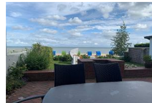
Die überdachte Terrasse ist möbliert.