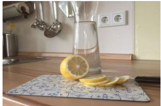
Sauer macht lustig ...