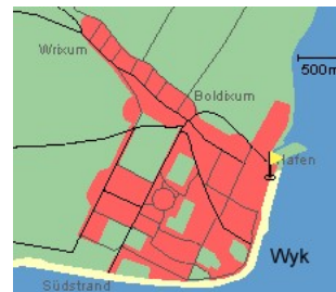
Entfernungen, zirka: zum Bäcker 25 m, zur Einkaufsmöglichkeit 25 m, zum Flugplatz 3,0 km, zum Golfplatz 3,0 km, zum Hafen 50 m, zum Meer 2 m, zum Badestrand 2 m, zum Ortszentrum 0 m