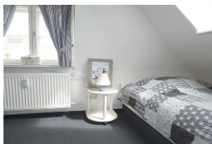
Das zweite gemütliche Schlafzimmer im Dachgeschoss verfügt über 2 Einzelbetten.