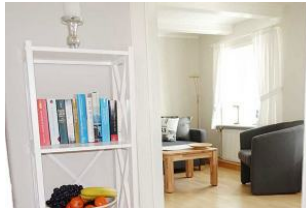
Das Ambiente der Wohnung wirkt heimelig und einladend.