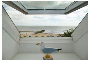
Von den Schlafräumen im DG hat man einen traumhaften Ausblick!