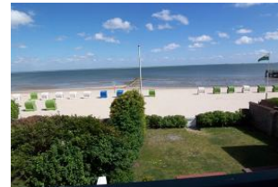
Das Foto zeigt den Blick vom Balkon des Hauses und das lädt zu jeder Jahreszeit ein. Hier können Sie einen Erholungsurlaub der kurzen Wege mit Nordseeluft pur genießen. Man spürt regelrecht die leichte Meeresbrise.....