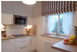
Hier macht auch das Kochen im Urlaub Spaß.