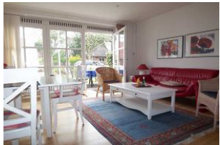
Das gemütliche Wohnzimmer mit Esstisch und Kamin ist hell gestaltet. LCD-Sat-TV mit DVD-Spieler und WLAN gehören zur Ausstattung.

Das Haus für Nichtraucher zeichnet sich durch die besonders ruhige Lage am Rand des alten Dorfkerns aus. Zum Nieblumer Strand sind es ca. nur 700 m. Das Mittelhaus bietet Platz für 4 Pers. + max. 1 Kleinstkind im Kinderreisebett und wurde kinderfreundlich eingerichtet. Im hellen Wohnraum mit Esstisch sitzt man gemütlich vor einem offenen Kamin. Ein PKW-Stellplatz befindet sich auf dem Grundstück.