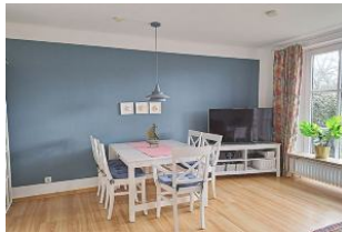
Die möblierte Terrasse mit Strandkorb (April - Okt.) erreichen Sie vom Wohnzimmer aus.