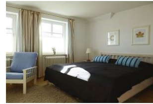
Das helle behagliche Schlafzimmer mit Doppelbett (180x200 cm), zwei Sesseln und einer kleinen Schreibablage.