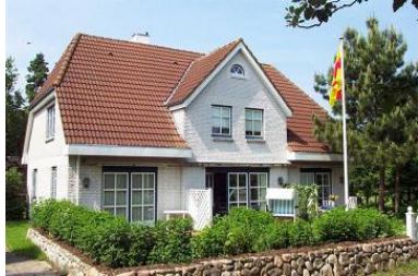
Das gemütliche Mittelhaus in Nieblum, Gartenstraße 12

Die Unterkunft verteilt sich über EG und 1.OG.