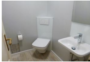
Im Erdgeschoss befindet sich ein modernes kleines Gäste-WC.