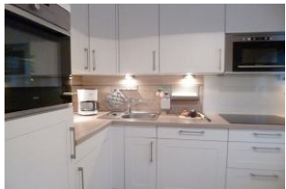
Die separate Küche mit Geschirrspüler, Nespresso Maschine, Waschmaschine und Mikrowelle ist komplett ausgestattet.