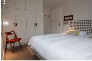
Der Einbauschranks für Kofferinhalte bietet genügend Platz