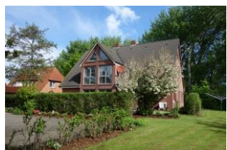
Das Haus Neshörn - Am Leuchtturm 4 in Wyk