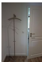
Der Flur mit Garderobe