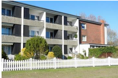
Das Matthias-Petersen-Haus von außen.