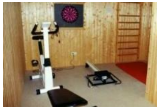
Der kleine Fitnessraum im Keller des Hauses.