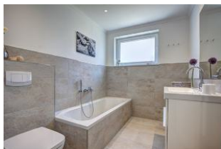
Bad mit Badewanne