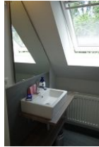
Das Gäste-WC im Dachgeschoß (nicht im Bild)