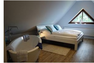
...WOW ... Das Schlafzimmer im Dachgeschoß