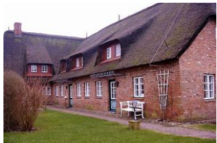
Aussenansicht des Hauses

Laerchenhus ist Teil eines ehemaligen altfriesischen denkmalgeschützten reetgedeckten Bauernhofes im historischen Kern des Inseldorfes Borgsum. Dieser Anbau befindet sich in der Seitenstrasse Alles neu und modern eingerichtetes Hausteil. Der große Garten wird von alten Laubbäumen beschattet. Über zwei Ebenen verteilt, bietet Ihnen unser Ferienhaus 'Laerchen's Hus' ein stilvolles Wohnen in behaglicher Atmosphäre ankommen und wohlfühlen. Im Erdgeschoss bietet Ihnen diese Wohnung viel Raum in dem grossen Wohnzimmer und der abgeteilt Küche mit dem grossen Esstisch. Auch wenn das Wetter mal nicht mitspielt können sie sich hier erholen, Im 1 OG befinden sich 3 Schlafzimmer und das Badezimmer mit Dusche und WC. Für gemeinsame Abende sind Gemeinschaftsspiele vorhanden, aber auch Bücher und Wlan Nutzung ist möglich. Hunde sind herzlich willkommen.