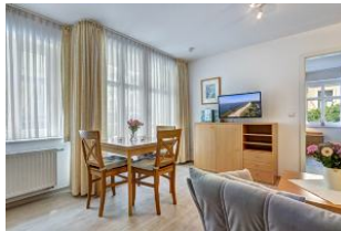
Wohnen, Essen, Blick zum Schlafzimmer