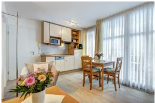
Küche, Wssen, Wohnen

1. Reihe, direkt an der Strandpromenade mit SÜDBALKON! FAHRSTUHL im Haus! Schönes 2-Zimmer-Apartment mit moderner guter Ausstattung. Separates Schlafzimmer (mit Fernseher), Wohnzimmer mit Küchenzeile mit Essplatz, Duschbad, Balkon zur Südseite mit Sonne bis abends. Die Wohnung verfügt über einen Pkw-Stellplatz. In der Garage können auch Fahrräder und ähnliches untergestellt werden. Von der "Villa Aquamarina" aus können Sie das Ortszentrum und die bekannte Ahlbecker Seebrücke in ca. 3 Minuten zu Fuß erreichen. Zum Strand sind es 50 m.