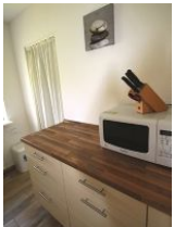
... mit moderner Mikrowelle und viel Platz.