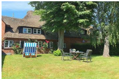
Aussenansicht vom "Haus an der Meere"