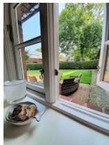
Der Blick auf die Terrasse.