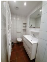
Das Duschbad befindet sich im 1. OG.