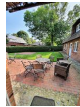
Viel Platz bietet die Terrasse.