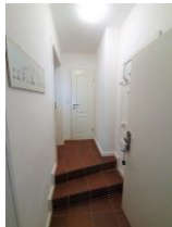
2 Eingangsstufen befinden sich im Flur.