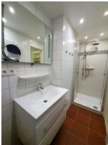
Die große Dusche im 1. OG.