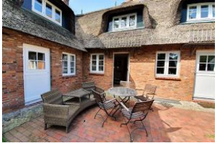
Der schöne Sitzplatz.