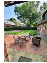
Viel Platz bietet die Terrasse.