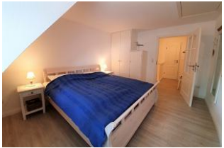
Der Einbauschränk bietet viel Platz für das Urlaubsgepäck.