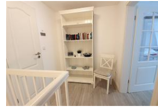
Der kleine Flur im 1. OG. Rechts befindet sich das Schlafzimmer, links das Duschbad.