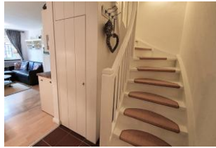
Die Treppe führt in das 1. OG zu Schlafzimmer und Duschbad.