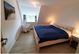
Das Schlafzimmer mit großem Doppelbett (180x200).