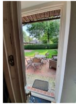
Ihr Sitzplatz im Freien.