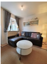
Die gemütliche Couchecke.