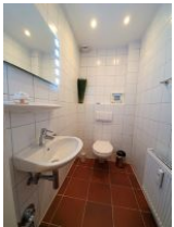
Im EG befindet sich ein zusätzliches WC.