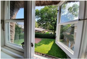
Der Blick aus dem Schlafzimmerfenster.