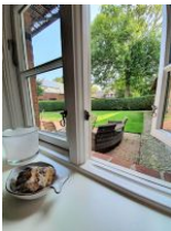
Der Blick auf die Terrasse.