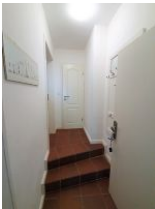
2 Eingangsstufen befinden sich im Flur.