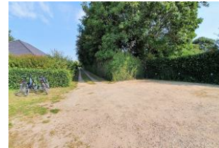
Die Zufahrt zum Haus mit eigenem Parkplatz.