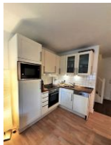
Die Küche ist gut ausgestattet.