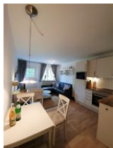
Das moderne Wohnzimmer mit offener Küchenzeile.

Herzlich Willkommen in der Wohnung Traumkoje. Die Wohnung ist hell, freundlich und modern eingerichtet und befindet sich in einem typischen Reetdachhaus. Umgeben von Feldern und viel Natur können Sie hier entspannen und Kraft tanken. Die Wohnung verteilt sich auf zwei Ebenen. Im EG befinden sich ein großer Wohnraum mit Essecke, einer gemütlichen Couch, einer gut ausgestatteten Küchenzeile sowie einem Gäste - WC. Im 1. OG befinden sich das Schlafzimmer und das Duschbad. Vor dem Haus steht Ihnen ein eigener Parkplatz zur Verfügung.