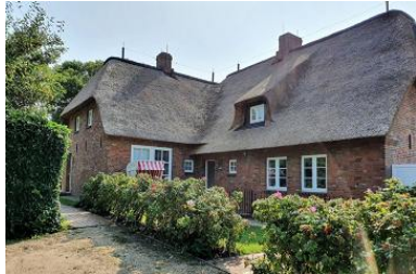
Das wunderschöne Reetdachhaus von außen.

Die Unterkunft verteilt sich über EG und 1.OG.