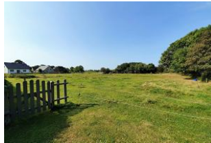
Sie treten aus der Wohnung und befinden sich in der Marsch.