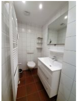
Das Duschbad befindet sich im 1. OG.