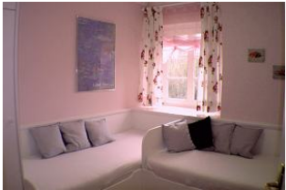
Kinderschlafzimmer; Größe der Einzelbetten 80/190 und 80/180. Liebevoll zum Träumen für Sie hergerichtet.

Entfernungen, zirka: zum Bäcker 1,5 km, zur Einkaufsmöglichkeit 2,0 km, zum Flugplatz 1,0 km, zum Golfplatz 900 m, zum Hafen 3,0 km, zum Meer 50 m, zum Badstrand 50 m, zum Ortszentrum 3,0 km