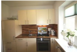
Auch das Kochen macht Spaß in der neuen, hellen und freundlichen Küche...