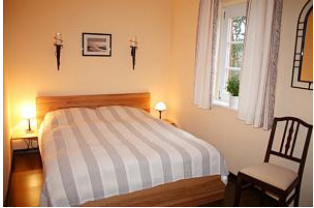
Dieses gemütliche Schlafzimmer lädt zum ruhevollen Schlafen ein,