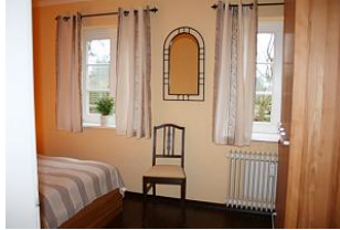
ein großer Schrank für das Urlaubsgepäck ist vorhanden.