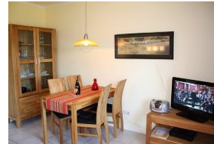
Die Essecke im Wohnzimmer bietet reichlich Platz für 4 Personen.