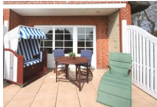
... auf Ihre eigene Südterrasse mit Strandkorb.