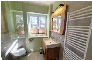
Das Badezimmer wurde 2022 frisch renoviert.