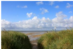
Der direkte Strandzugang ist keine 100 Schritte entfernt.