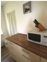
... mit moderner Mikrowelle und viel Platz.