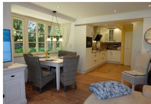
Derr Esstisch, die offene Küche.