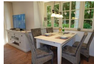
...der Tisch ist schon gedeckt !