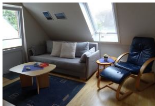
Von hier haben Sie einen direkten Ausgang auf den kleinen Balkon.