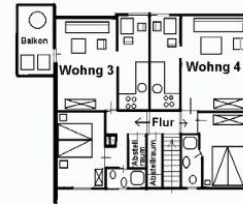
Der Grundriss der Wohnung 3.