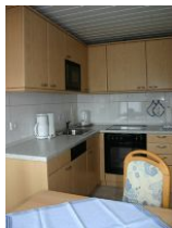
Die separate Küche ist vollausgestattet mit Backofen, Geschirrspüler und auch Mikrowelle.