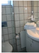
Das Badezimmer mit Dusche.