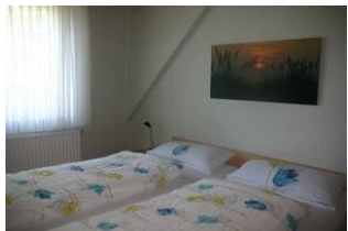
In dem gemütlichen Schlafzimmer können Sie einen erholsamen Schlaf genießen und mit Vogelgezwitscher im Sommer aufwachen.