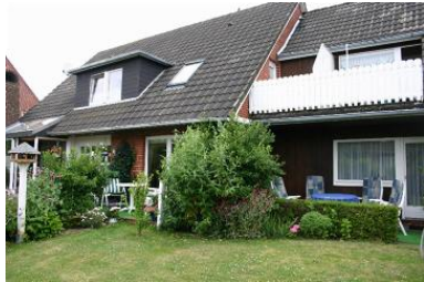
Das Haus "Pidder Lyng" mit den insgesamt 5 Wohneinheiten.