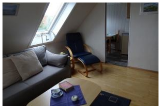
Das helle Wohnzimmer lädt zum Relaxen ein.

Das Haus "Pidder Lyng" - gelegen in Utersum - bietet Ihnen alles, was Sie sich für einen erholsamen Urlaub wünschen können. Das Dorfzentrum befindet sich 800 Meter entfernt und der schönste Strand der Insel ist in wenigen Gehminuten erreichbar. Die helle, sonnige Ferienwohnung mit Balkon verfügt über einen Schlafraum, eine separate Küche, ein Badezimmer mit Dusche sowie einen kombinierten Wohn-/Schlafraum. Alle Räume wurden mit viel Liebe zum Detail eingerichtet. Die hochwertige Ausstattung reicht vom eigenen Parkplatz, über Backofen und Geschirrspüler bis hin zum WLAN-Anschluss.