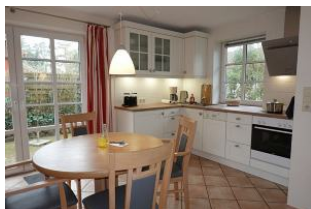
...die neue Küche (Feb 2024)