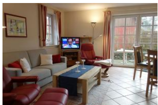
... und der zweite gemütliche Sessel.