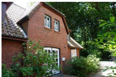
Die Aussenansicht des Hauses Eulenkamp 6c

Die Unterkunft verteilt sich über EG und 1.OG.