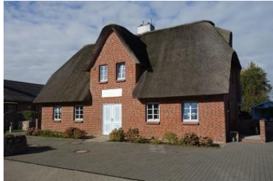
Das Doppelhaus Golfoase, Haus 1 befindet sich rechts

Die Unterkunft verteilt sich über EG und 1.OG.