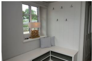
Der Eingangsbereich, Platz für Outdoorkleidung und Schuhe

Im idyllischen Ort Oevenum finden Sie das Doppelhaus Golfoase. Zwei großzügige Doppelhaushälften für je 6 Personen erwarten Sie. Ein gemütliches Wohnzimmer mit offener Küche und familientauglichem Essplatz, Austritt in den Garten und zur möblierten Terrasse, Sauna (mit Zusatzkostenverbunden). Ein großes Badezimmer mit Waschmaschine und Trockner. Im Obergeschoß die Schlafräume und ein weiteres Dusch+Wannenbad. Hier ist an alles gedacht, hier kann man sich wohlfühlen, hier... wird es Ihnen einfach nur gut gehen und das Beste.....Ihr Vierbeiner darf auch dabei sein.